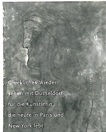
Glückliches Wiedersehen mit Dusseldorf für die Künstlerin, die heute in Paris und New York lebt

einfach eine große Dame, die einen ganz besonderen Charme hat. Nein, sie ist selbst Künstlerin, damals ganze 22 Jahre alt, bekam schon 1943 eine eigene Ausstellung in Paris aber mit fundierter Ausbildung an der Ecole des Beaux Arts in Paris. Es war die Zeit, in der sie Picasso kennen lernte, im Café de Flore, einem der legendären Künst-