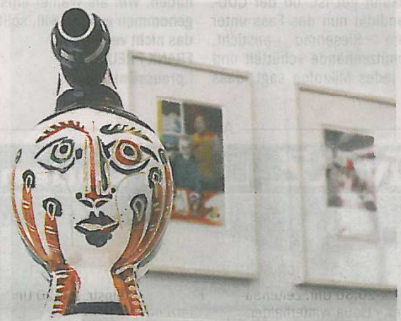
Hier die Keramik „Canard pique-fleurs“ von 1951. Im Hintergrund Picasso mit Ehrenbourg.

sche übermalt, sie zeigen ihn mit seinem Freund, dem russischen Schriftsteller Ilja Ehrenbourg Anfang der 60er. Später sollten sich die beiden verkrauchen. Picasso hat dem Freund mit blauer Tusche einen neuen Pullover verpasst, sich selbst staffierte er mit einer Weihnachtsmannmütze aus. Davor ruht in einer Vitrine ein kleiner